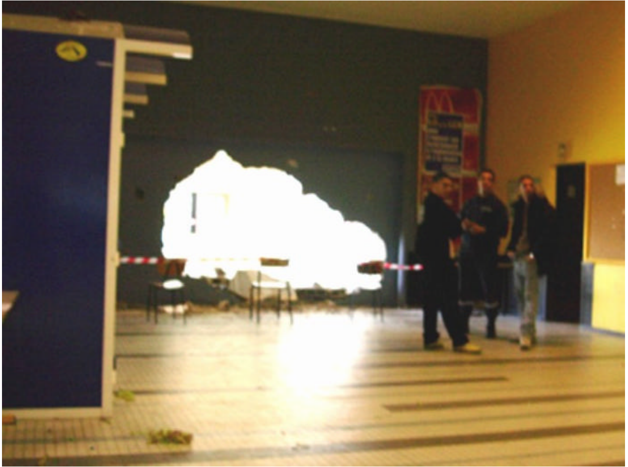
CRITIQUE DE LA SÉPARATION (Mur à Nanterre Paris X, mars 2004)